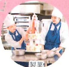
製菓 クリエイトコース