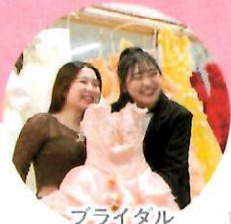
ブライダル デザインコース