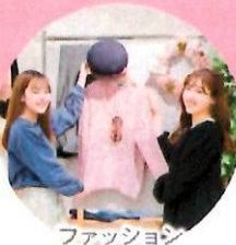
ファッション デザインコース