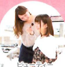
ビューティー デザインコース